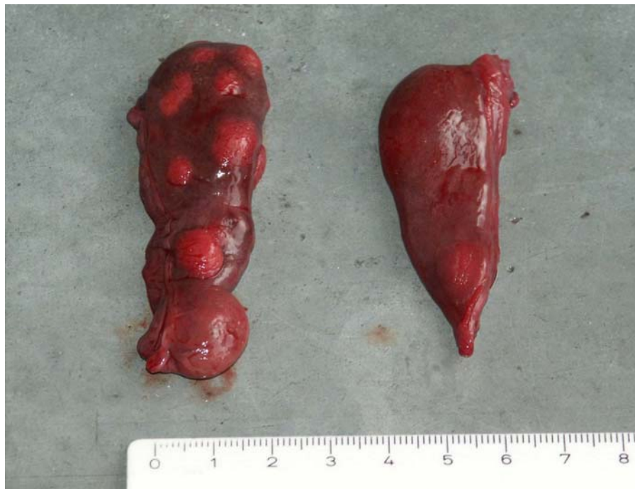
Slika 3: Prikaz lijevog (lijevo na slici) i desnog jajnika spolno zrele ženke dobrog dupina ( Tursiops truncatus ) oznake 102, u dobi od 20 godina iz Jadranskog mora