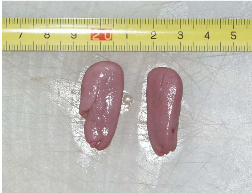
Slika 2: Prikaz lijevog (lijevo na slici) i desnog jajnika spolno nezrele ženke dobrog dupina ( Tursiops truncatus ) oznake 118 iz Jadranskog mora,

da ženke koje su manje od 246 centimetara nemaju niti jedan ožiljak na jajnicima (slika 4). Također ožiljci na jajnicima se počinju prvi puta pojavljivati na jajnicima u dobi od sedam godina što upućuje na spolne zrelost dobrih dupina u Jadranskom moru u toj dobi (slika 5). Najlakša spolno zrela ženka ima 163 kilograma (dupin 35). Ženka koje je najviše puta imala ovulaciju (dupin 54), tj. 21 puta, ima 17 godina.