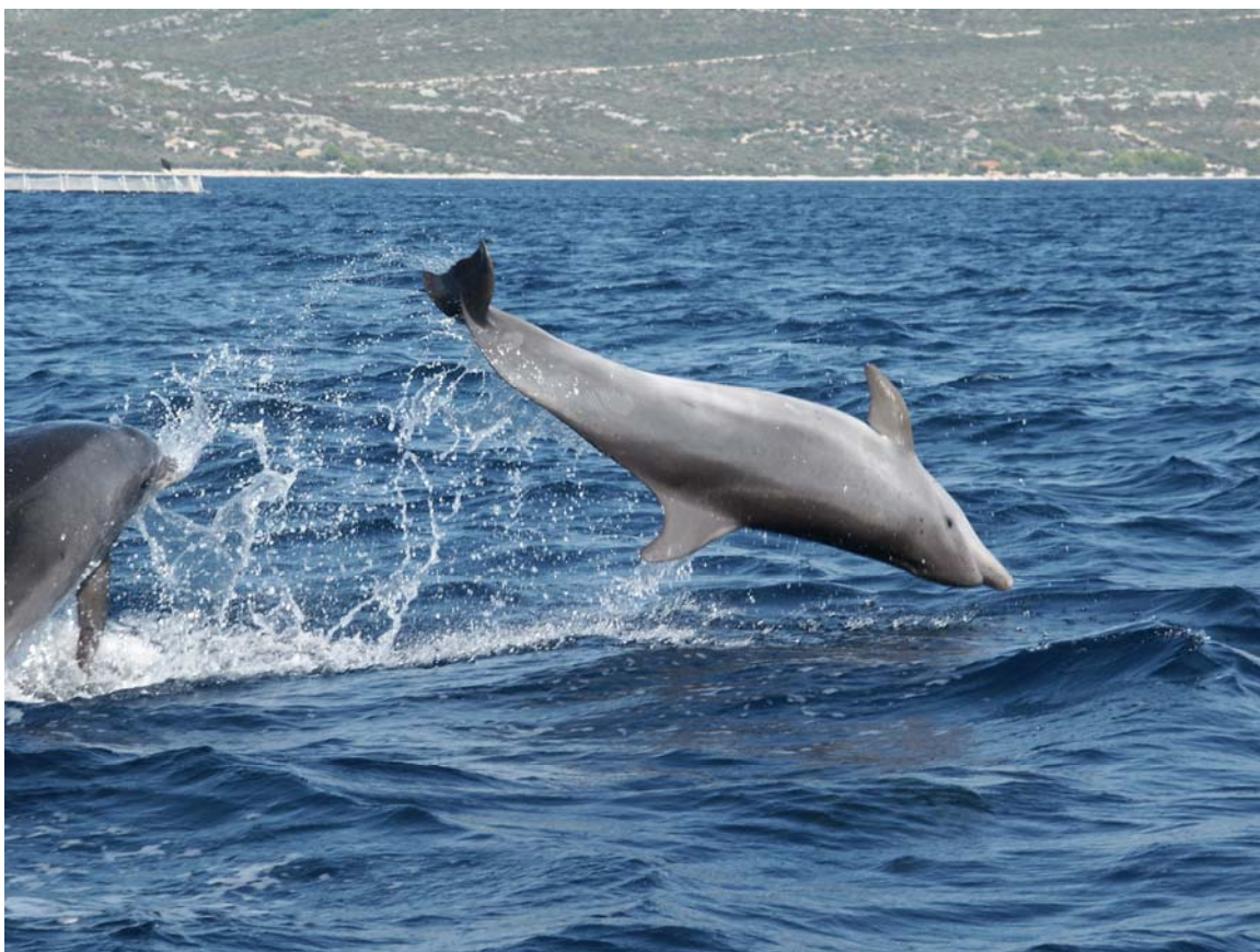
Slika 1: Dobri dupin ( Tursiops truncatus ) u Jadranskomu moru

Pontoporia blainvillei (Gervais et d'Orbigny, 1844), Blainvilleov dupin, engl. Franciscana