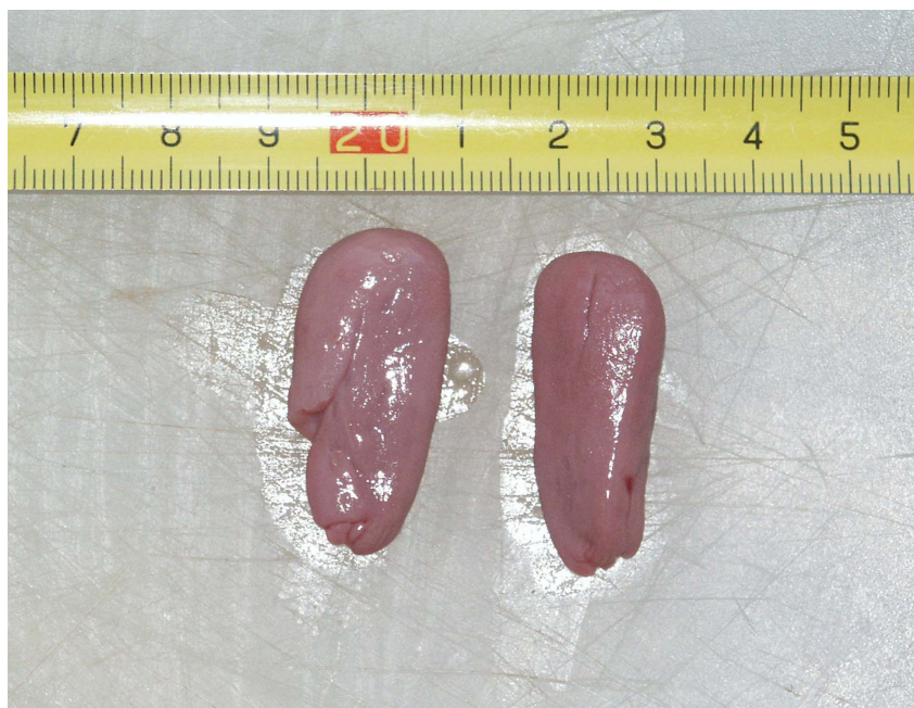
Slika 1. Prikaz lijevog (lijevo na slici) i desnog jajnika spolno nezrele ženke dobrog dupina ( Tursiops truncatus ) oznake 118 iz Jadranskog mora

starijih, nalazi određeni broj ožiljaka na jajnicima koji su makroskopski dobro vidljivi (slika 2). Dob, tjelesna masa, ukupna duljina tijela, te mjere jajnika i broj ožiljaka na jajnicima prikazani su za sve istražene životinje i odvojeno za spolno zrele jedinke u tablici 1. T- testom je dokazana statistički značajna razlika između lijevog i desnog jajnika u masi i broju ožiljaka. Lijevi jajnik ima značajno veću masu ( p=0,0004 ), te ima značajno više ožiljaka ( p=0,0012 ). Najmlađa spolno zrela ženka ima 7 godina (dupin 57), a ta životinja ujedno je i najmanja spolno zrela ženka ukupne duljine tijela od 246 centimetara. Pri usporedbi ukupne duljine tijela i broja ožiljaka vidljivo je da ženke koje su kraće od 246 centimetara nemaju niti jedan ožiljak na jajnicima (slika 3). Također ožiljci na jajnicima se počinju prvi puta pojavljivati u dobi od sedam godina što upućuje na spolnu zrelost dobrih dupina u Jadranskom moru u toj dobi (slika 4). Najlakša spolno zrela ženka ima 163 kilograma (dupin 35). Ženka koje je najviše puta imala ovulaciju (dupin 54), tj. 21 puta, imla je 17 godina.