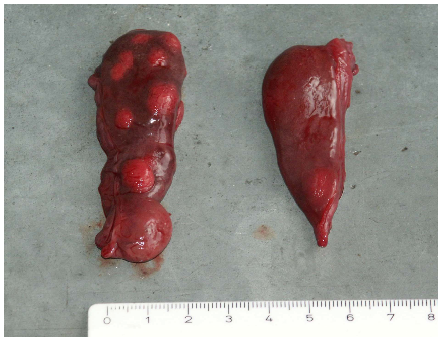
Slika 2. Prikaz lijevog (lijevo na slici) i desnog jajnika spolno zrele ženke dobrog dupina ( Tursiops truncatus ) oznake 102, stare 20 godina iz Jadranskog mora